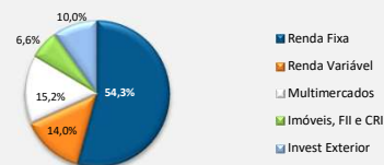
Carteira do Plano